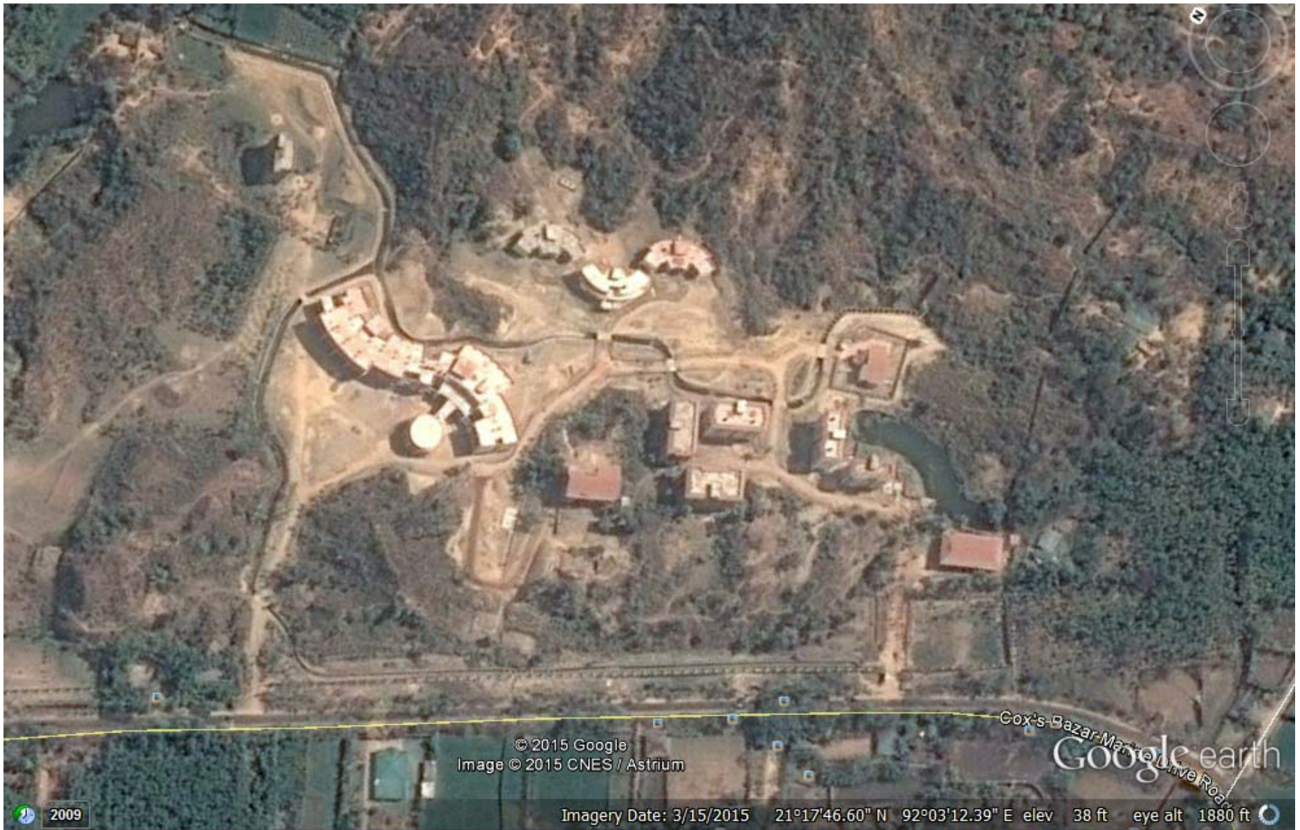
Sattelite View of NORI project area (15/03/2015)