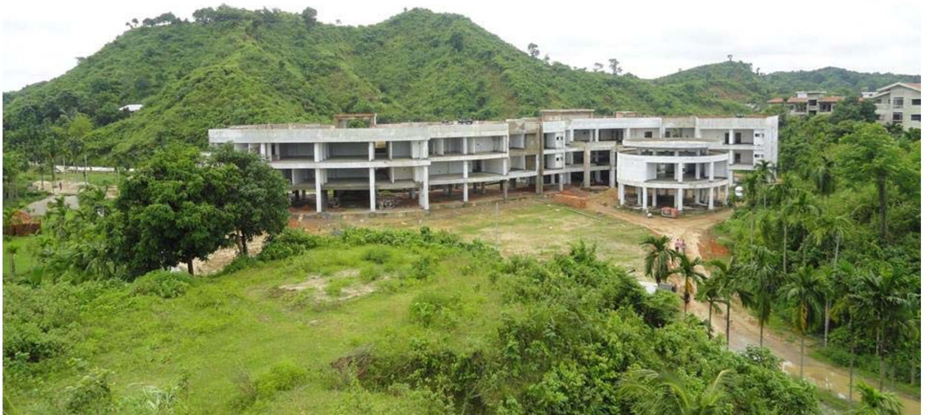
Institute Building of National Oceanographic Research Institute (NORI)