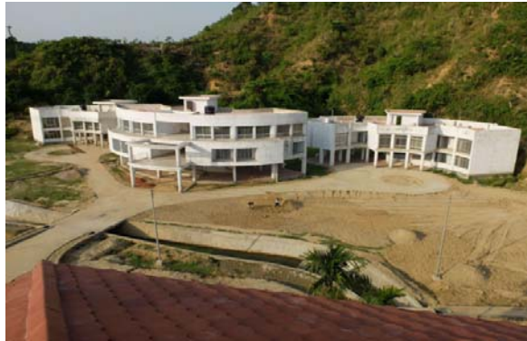
Dormitory & club building